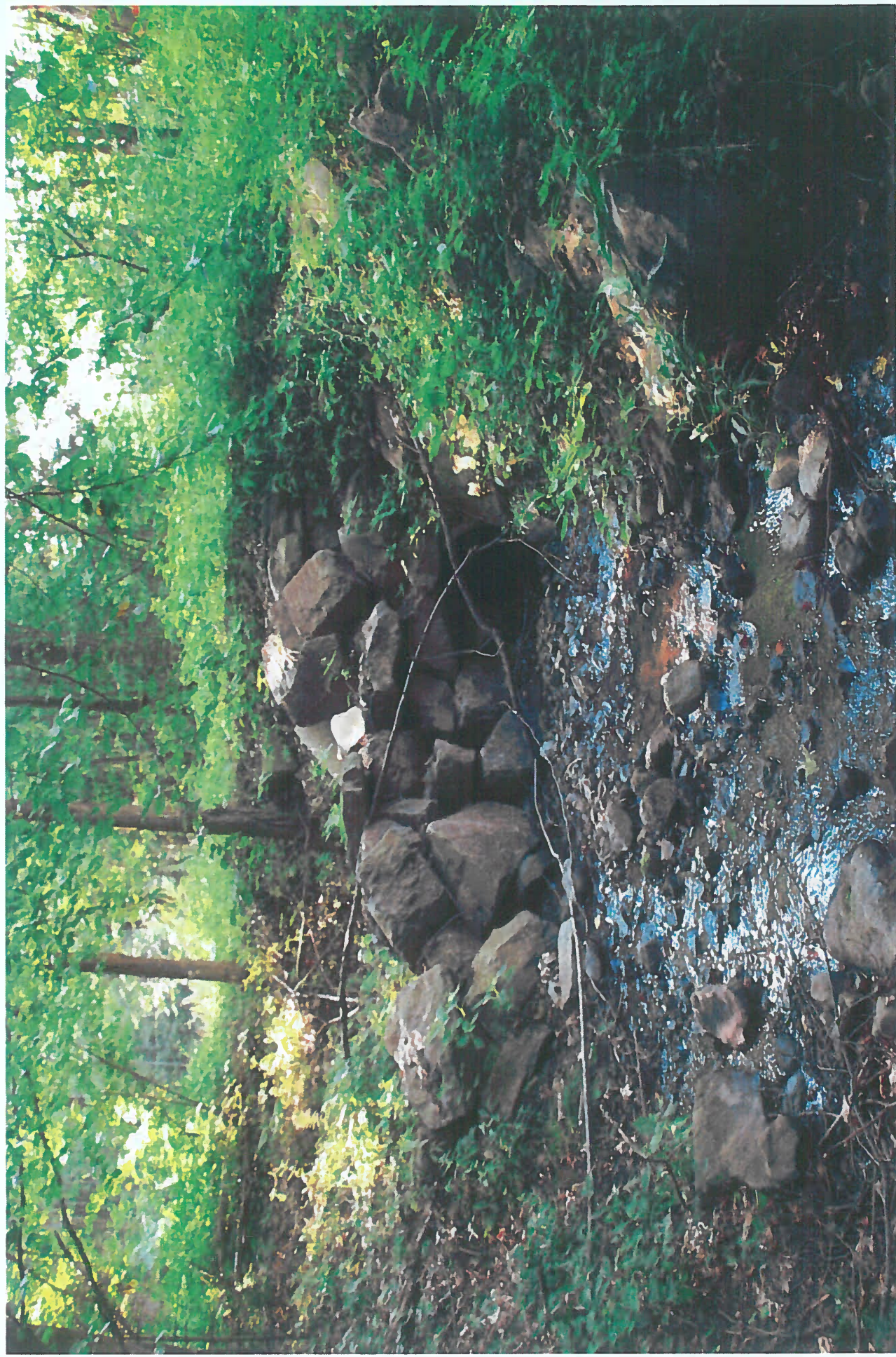
QR kód – 07: Malý Tarnovský potok – Kopaný jarok