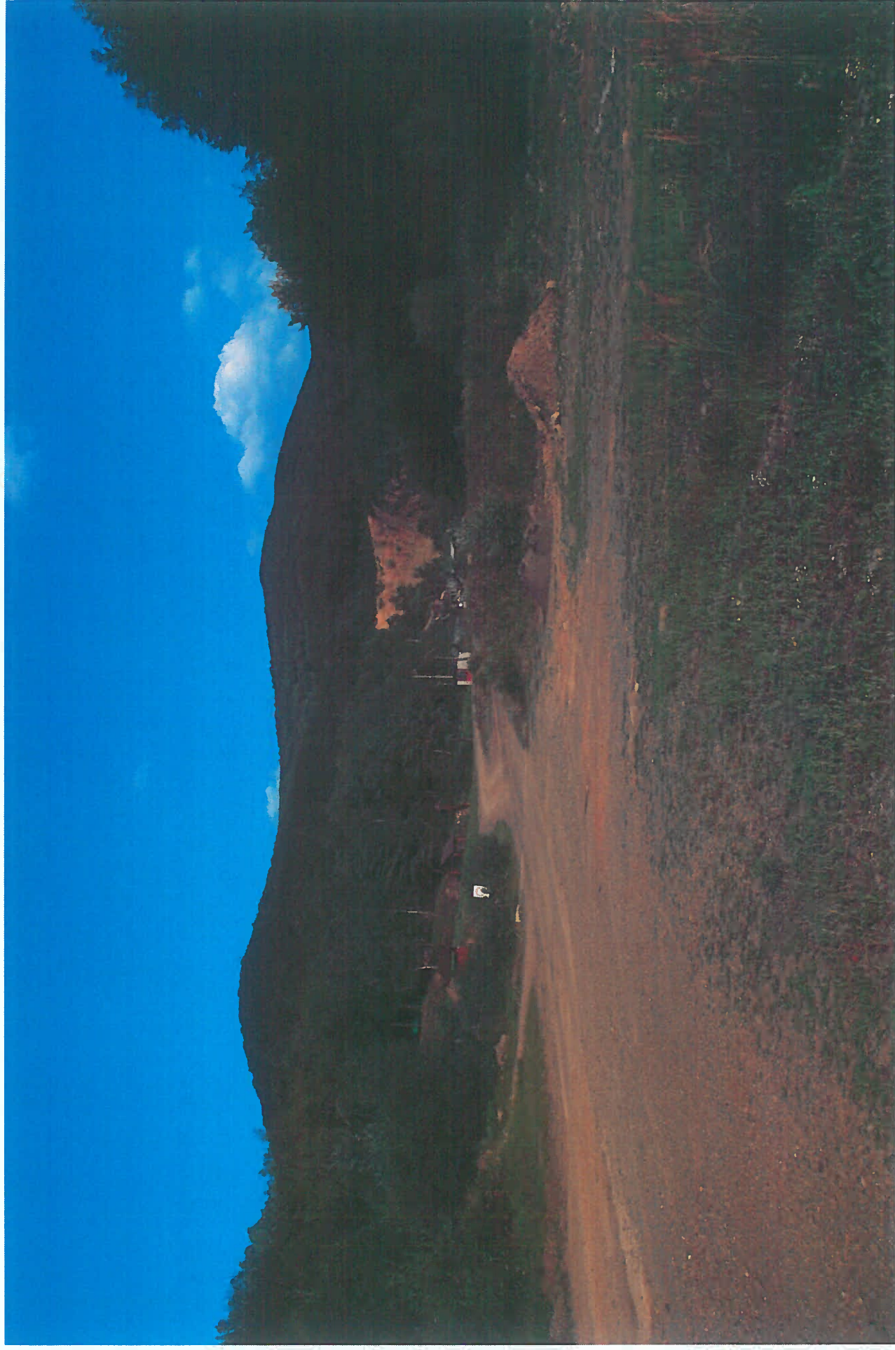
QR kód – 01: S.U.L.D – odbočka Barnová (historické foto)